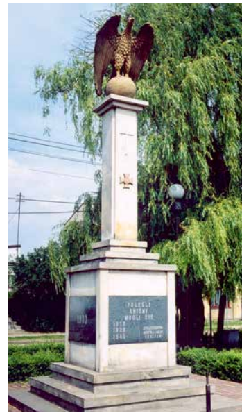
Pomnik w Rynku

Z rynku kierujemy się ul. Żaboklickiego w stronę kościoła. Po prawej stronie murowany, XIX-wieczny zajazd, obecnie