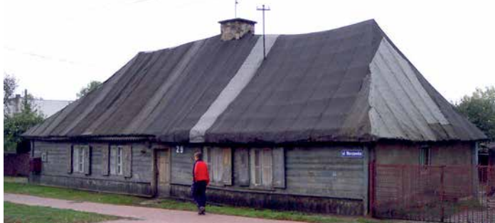
Ul. Świderska – dawna karczma