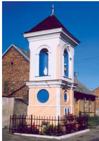
Kapliczka przy ul. Kościelnej

mieszkańców miasta zamordowanych w Katyniu w 1940 r. Wokół terenu kościelnego zachowało się sporo drewnianej, małomiasteczkowej zabudowy z końca XIX i początku XX w. Spod świątyni kierujemy się ul. Mickiewicza w stronę zakładów chemicznych INCO. Przy skrzyżowaniu z ul. Armii Krajowej – ciekawa figura św. Antoniego z pocz. XX w. Przechodząc przy ogrodzeniu zakładów INCO, warto zwrócić uwagę na szary budynek z półkolistym dachem i tuż za nim mały niepozorny parterowy