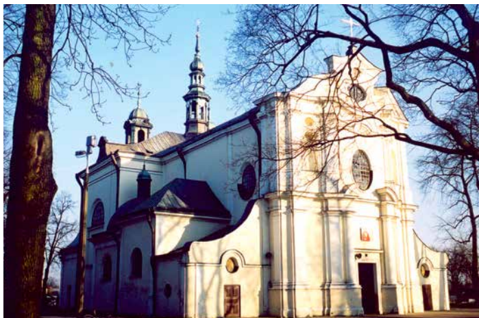
Kościół św. Wita