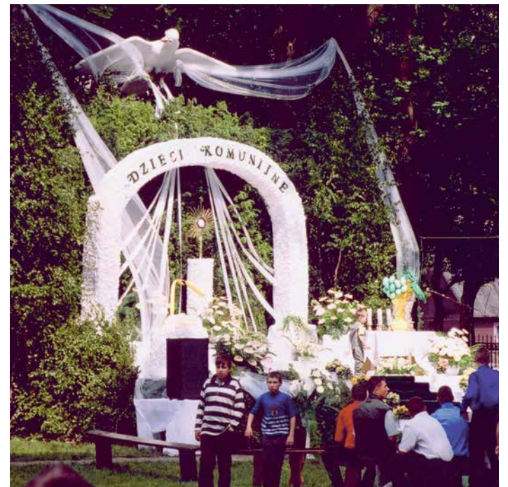
Ofiary na Boże Ciało – 2002 r.