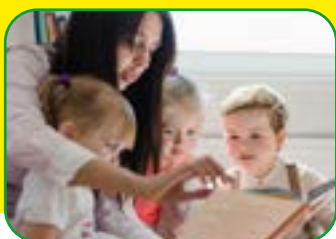
OPIEKUNKA DZIECIĘCA TRYB DZIENNY, WIECZOROWY I ZAOCZNY

zaprasza młodzież i dorosłych na BEZPŁATNE kierunki daytime, zaoczne i wieczorowe