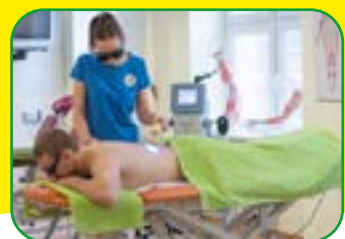
TECHNIK MASAŻYSTA TRYB DZIENNY I WIECZOROWY