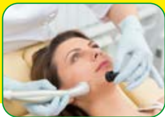
KOSMETYCZKA TRYB DZIENNY I ZAOCZNY