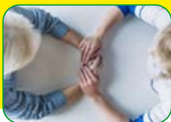
OPIEKUN MEDYCZNY TRYB ZAOCZNY