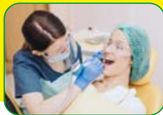
HIGIENISTKA STOMATOLOGICZNA TRYB DZIENNY I WIECZOROWY