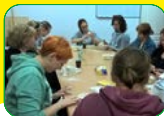
TERAPEUTA ZAJĘCIOWY TRYB DZIENNY I WIECZOROWY