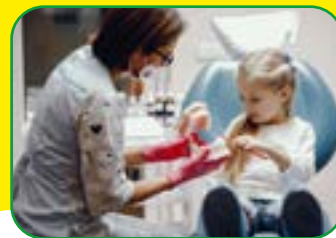
ASYSTENTKA STOMATOLOGICZNA TRYB DZIENNY I WIECZOROWY